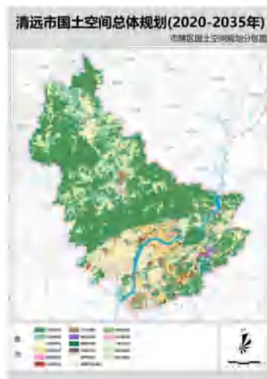
图2 清远市国土空间总体规划图

探索“一区多园”发展模式，构建以民族工业园、阳山七拱产业园、连南产业园、连山产业园为载体的北部绿色发展协作区。充分利用矿产、旅游、农产品等资源优势，培育壮大绿色低碳工业、现代农林业、绿色食品、生态旅游、生物医药、健康医养、森林康养等生态产业。构建生态保护与经济发展相互促进的产业体系。